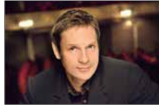
Simon Keenlyside & Malcolm Martineau Lieder

Si existeix una composició clàssica que pràcticament es pot considerar un culte pop, aquesta és el número de catàleg 988 de Johann Sebastian Bach: les Variacions Goldberg . En la línia d'oferir els millors intèrprets i les millors creacions, el Palau presenta Sir András Schiff i la seva brillant versió de la legendària obra de Bach. Un tema que es desenvolupa fins a l'infinit, paroxisme de complexitat, bellesa i una estranya matemàtica pianística que, segles després, encara conserva intacta la capacitat d'encís. Abans d'aquest tour de force interpretatiu, dues obres contingudes al Clavier-Übung II del Kantor de Leipzig: l' Obertura francesa i el Concert italià . El binomi Bach-Schiff ja és una categoria en si mateixa; un concert que esdevindrà legendari.