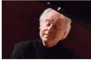
Sir András Schiff , piano Variacions Goldberg de Bach