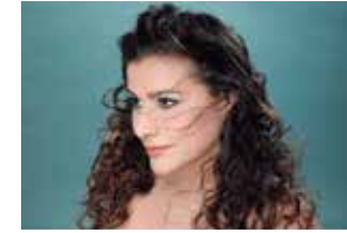
Cecili Bartoli La Cenerentola de Rossini