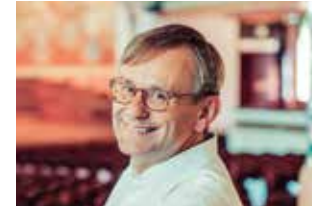
Simon Halsey & Orfeó Català

El prestigiós bariton anglès Simon Keenlyside és un dels millors liederistes de la seva generació i, havent trepitjat els escenaris més importants del món, com el Metropolitan de Nova York, Covent Garden de Londres, Opéra de París, Staatsoper de Viena o Glyndebourne, entre d'altres, ara debuta al Palau de la Música Catalana en el context del Festival LIFE Victoria. Acompanyat pel pianista Malcolm Martineau i amb repertori de cançons de Schubert, Wolf, Poulenc, Fauré, Vaughan Williams, Ireland i Grainger. Una oportunitat per descobrir el costat més intimista d'una veu única.