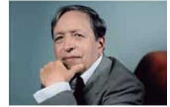
Murray Perahia , piano