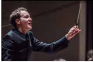
La Novena de Beethoven Orquestra Simfònica del Vallès