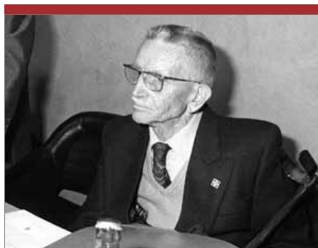
L'escriptor Raimon Galí va morir el 2005

BARCELONA 19.30 DOCUMENTAL Dins el cicle Hamaca , Arts Santa Mònica projecta el documental Basilio Martín Patino, La décima carta , de Virginia García del Pino.