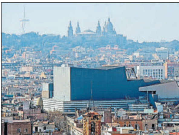
El Liceu és un dels equipaments que s'han adreçat a Ada Colau