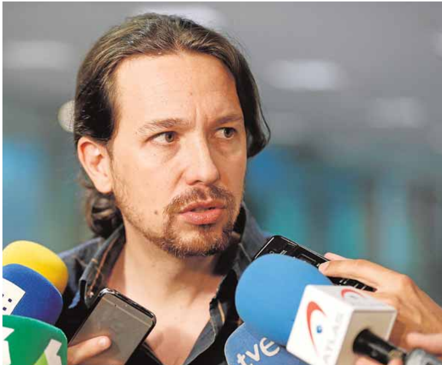
Pablo Iglesias, ayer en el Congreso de los Diputados.

El Consejo de Informativos de TVE exigió ayer la dimisión de la dirección de los Servicios Informativos y del director de TVE por las informaciones sobre la conversación entre el ministro del Interior y el jefe de la Oficina Antifraude. En un comunicado, el Consejo consideró «inaceptable la ocultación y el tratamiento parcial de la información» sobre dicha grabación. «Ni el Telediario 2ª Edición, ni La Noche en 24H, ni el Telediario Matinal han informado sobre este asunto».