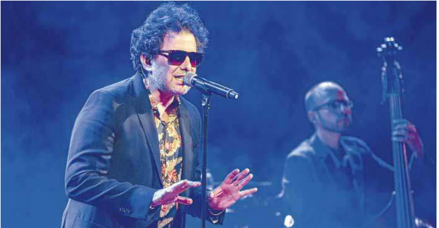
►► Andrés Calamaro, en un concierto celebrado el pasado día 6 de junio en el Palau de la música de Barcelona, con la formación 'acústica' con la que hoy actúa en el Zaragoza.