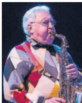
El veterà saxofonista Lee Konitz oferirà dos concerts