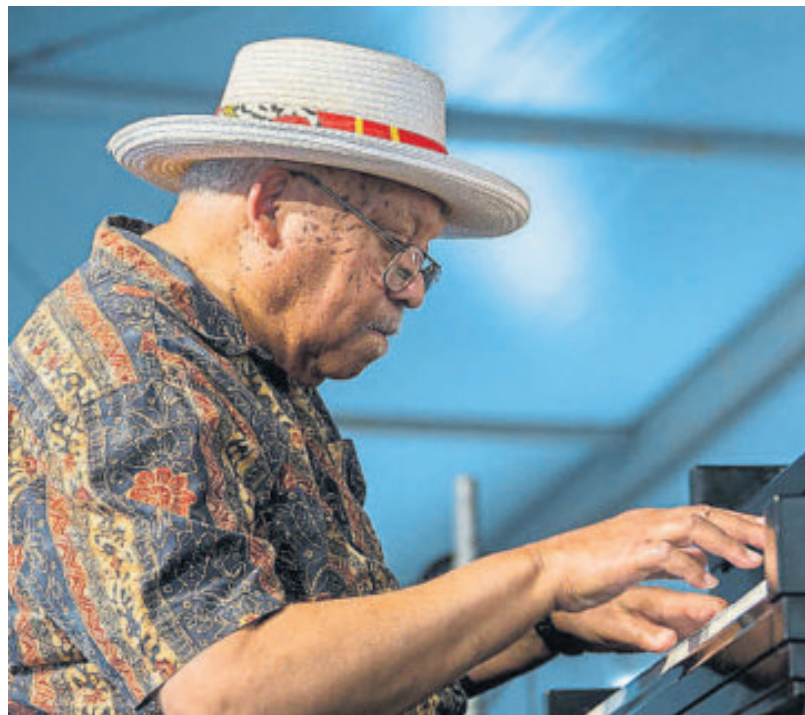
El pianista de Nova Orleans Ellis Marsalis és una de les grans apostes jazzístiques del festival