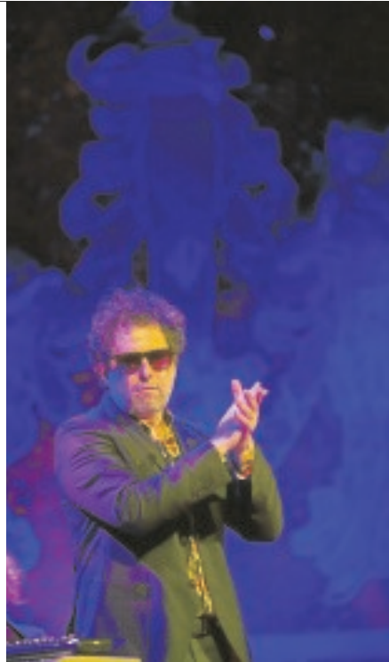
Calamaro, en el Palau

L a otra noche, en el Palau, Andrés Calamaro se sintió incómodo. Lo contó él mismo en estas páginas. Durante la interpretación de la canción Media Verónica -dedicada a las verónicas de José Antonio Morante de la Puebla y José María Manzanares-, «algo que no puedo explicar ocurrió». Prosigue: «la canción de marras no terminó de acomodarse en su ritmo y compás y no cuadró en todo lo que duran los versos. Entonces... es que no dejé de pensar en la imprudencia cometida en un lugar donde la tauromaquia fue acorralada y finalmente prohibida, y mi intención no había sido polemizar». Las palabras de Andrés Calamaro brindan un ejemplo de la espiral del silencio de la que