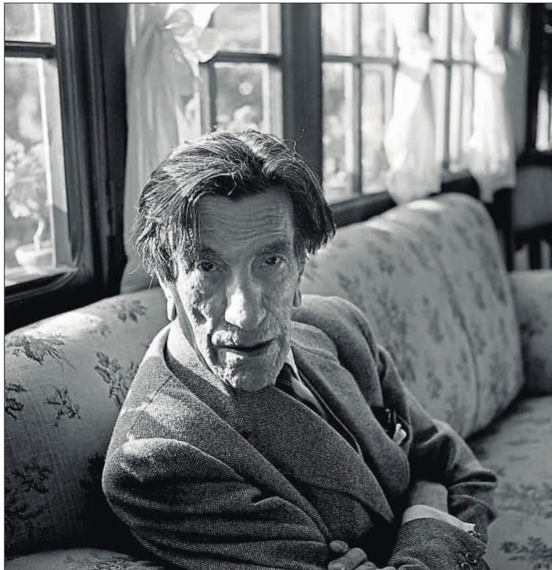
El violinista Costa, en un retrat de Francesc Català-Roca, que forma part de la col·lecció del Reina Sofia FRANCESC CATALÀ-ROCA / ARXIU HISTORIC COAC