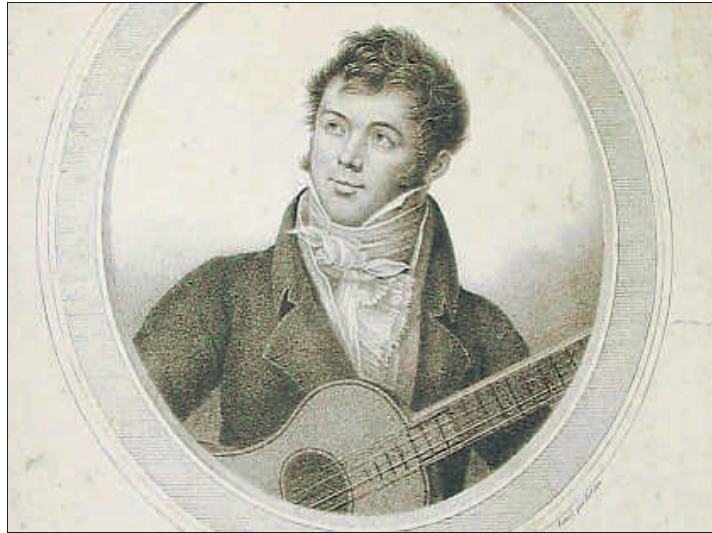
El guitarrista i compositor barceloní Ferran Sor (1778-1839)

Fa també un lustre es posava en marxa a Cervià de Ter un festival impulsat per l'Associació d'Amics de Cervià Antic per a la recuperació i divulgació del patrimoni històric de l'enclavament, que amaga no només un dels conjunts monumentals més atractius de la terres de Girona, sinó un dels arxius més excepcionals de Catalunya, el del monestir de Santa Maria de Cervià, que data de l'any 1053. Ibercamera va rebre l'encàrrec d'aquesta associació el 2011: calia organitzar un festival d'estiu. Un que a més tragués a la palestra joves músics de l'escena local. L'edició d'aquest any, que se celebra entre l'últim cap de setmana de juliol i el 15 d'agost, tindrà tres concerts a preus molt assequibles (de 12 a 16 euros, o abonaments de 30). Els protagonitzaran ni més ni menys