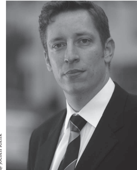
@ Jochen Klenk

Nascut en Laitila (Finlàndia), va fer el debut operístic als 25 anys com a Figaro ( Le nozze di Figaro ). Després de guanyar el segon premi del Concurs de Cant Timo Mustakallio el 2004 va començar una gran carrera internacional. Entre el 2005 i el 2010 va ser membre de la companyia de l'Òpera Estatal de Baden, amb la qual cosa va incrementar notablement les seves actuacions a Alemanya i va assimilar un extens repertori: Felip II ( Don Carlo ), Colline ( La Bohème ), Raimondo ( Lucia di Lammermoor ), Sarastro ( La flauta màgica ) i Comendador ( Don Giovanni , etc.). A més, va interpretar el seu primer paper en la Tetralogia wagneriana i va debutar com a Fafner ( Das Rheingold ), Hunding ( Die Walküre ) i Fafner ( Siegfried ).