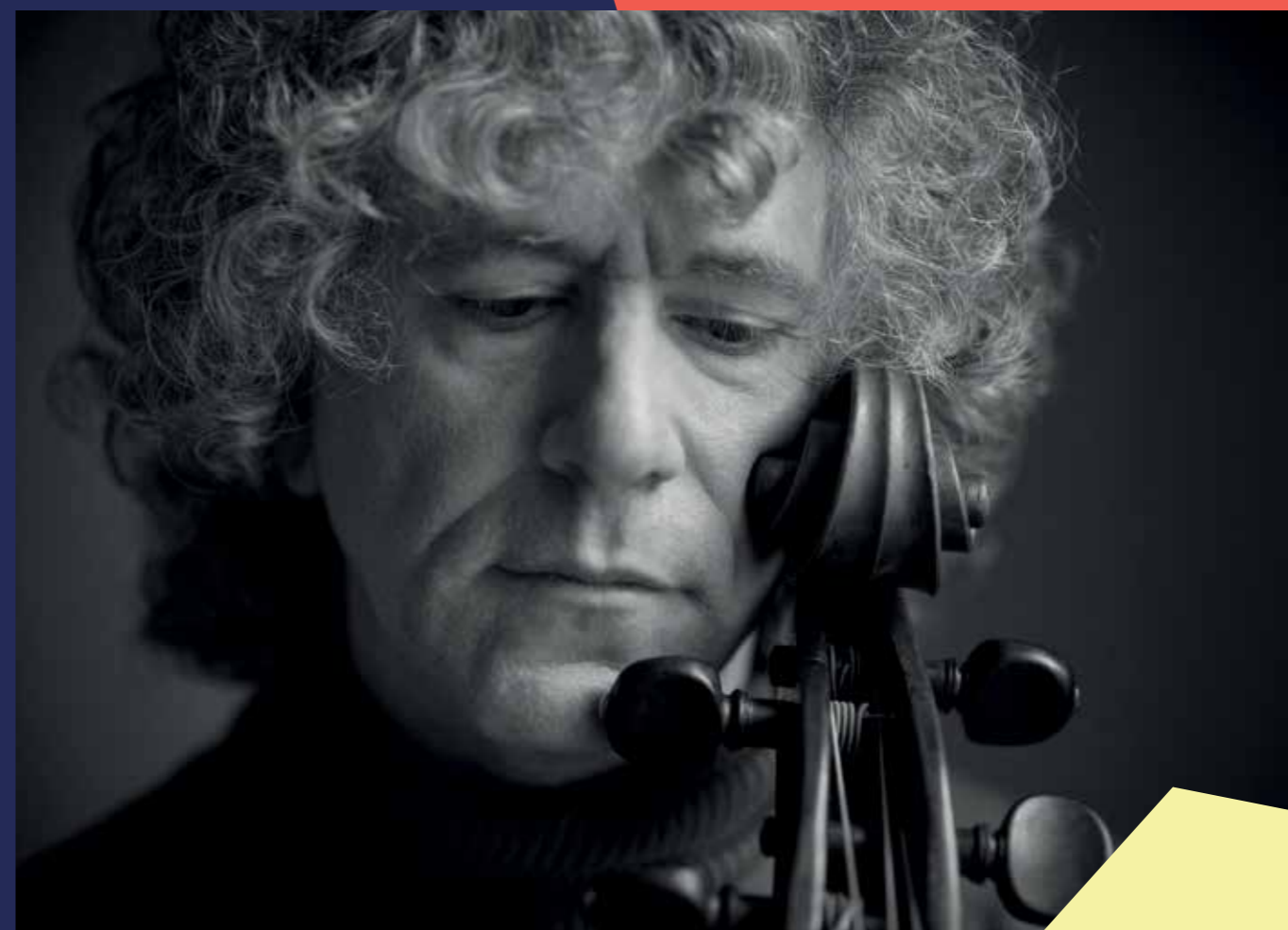
Depòsit legal: B22254-2017

DIJOURS, 28.09.2017 – 20.30 h Palau de la Música Catalana Sala de Concerts Palau Bach