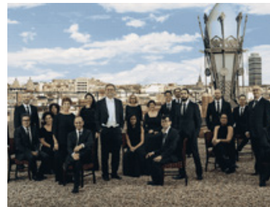
Cor de Cambra del Palau de la Música Catalana

L'agenda d'aquesta temporada inclou actuacions amb la London Symphony Orchestra, dirigida per S. Rattle, al Palau, i una gira amb G. Dudamel i la Mahler Chamber Orchestra amb Fidelio de Beethoven.