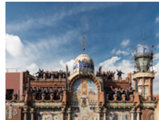
Cor Jove de l'Orfeó Català

Aquesta temporada 2019-20 destaquen les col·laboracions amb l'Orquesta Sinfònica de Tenerife, amb l' Oratori de Nadal de Bach al desembre; amb P. McCreech i els Gabrieli Consort & Players i el Cor Jove de l'Orfeó Català, amb Les estacions de Haydn per l'abril, i la gira amb G. Dudamel, al costat de la Mahler Chamber Orchestra i l'Orfeó Català, amb Fidelio de Beethoven també a l'abril.