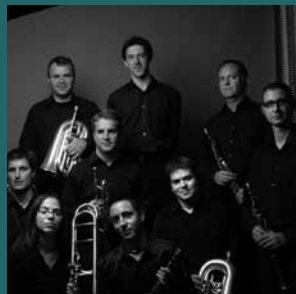
Cobla Sant Jordi – Ciutat de Barcelona Grans èxits de la sardana