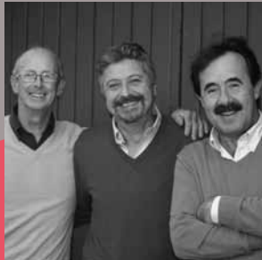
Havaneres de Calella de Palafrugell 50è aniversari