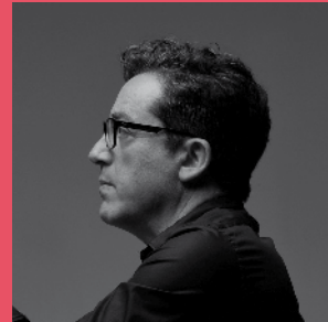
Llibre vermell de Montserrat 30è aniversari de la Capella de Ministrers