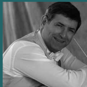
Banda Municipal de Barcelona