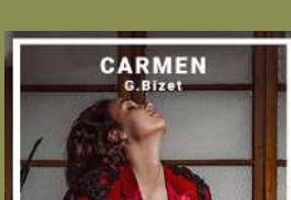
CARMEN G. Bizet 12 JUNY 2021 04 JULIOL 2021