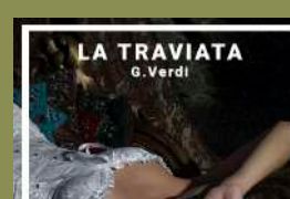
LA TRAVIATA G. Verdi 24 JUNY 2021