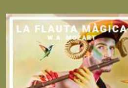
LA FLAUTA MÀGICA G. Mozart 24 MAIG 2021