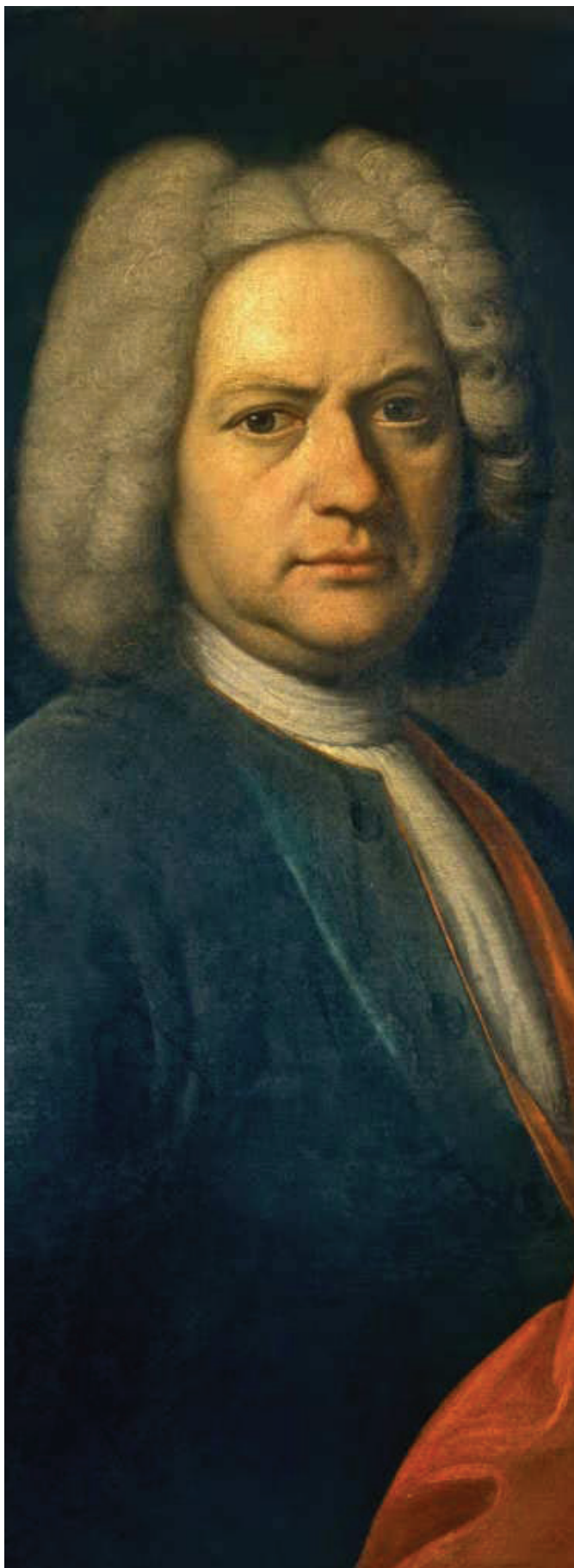
J. S. Bach (Johann Jakob Ihle, 1720)