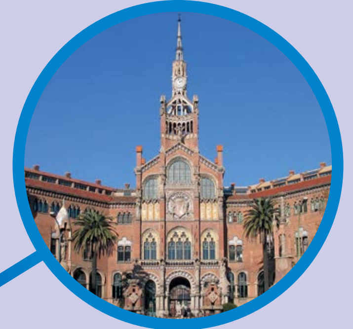
Hospital de Sant Pau Barcelona