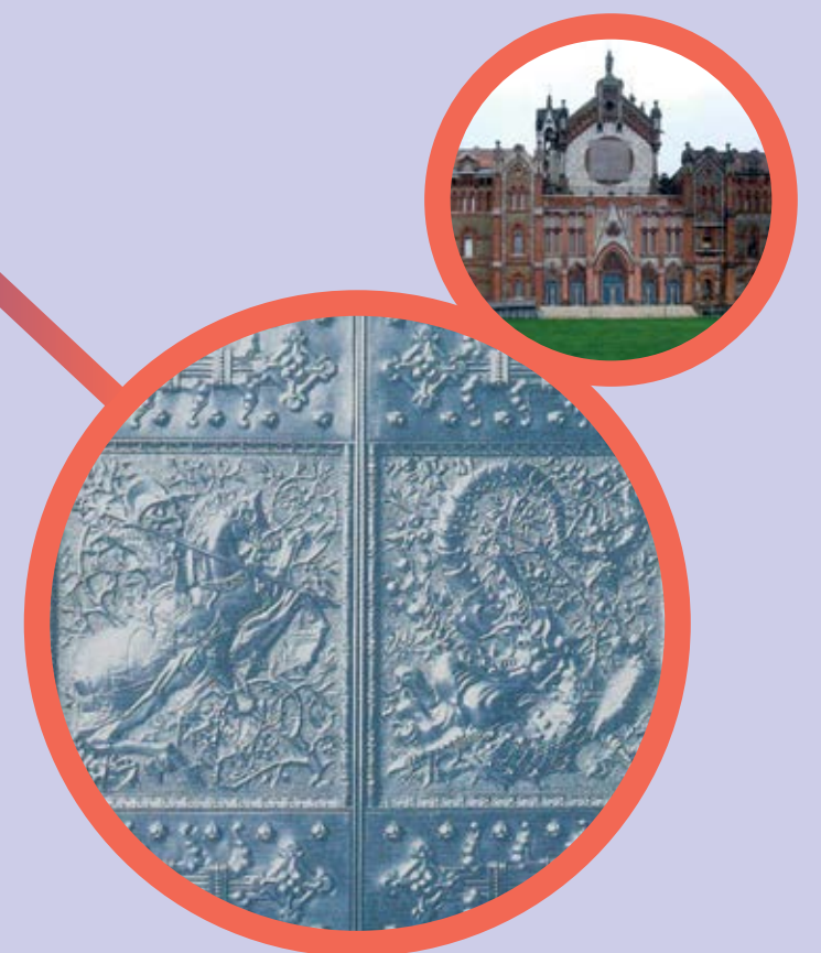
Porta Sant Jordi Universitat de Comillas Comillas (Santander)

¿Sabies que aquests altres espais també són obra de Lluís Domènech i Montaner?