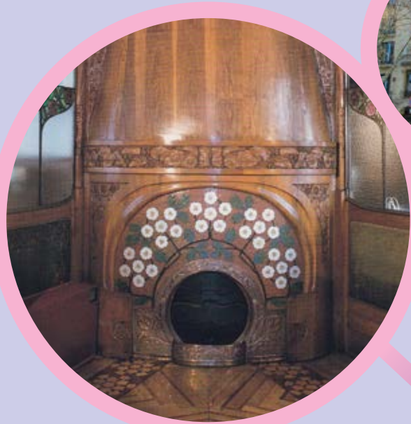
Llar de foc Casa Lleó i Morera Barcelona