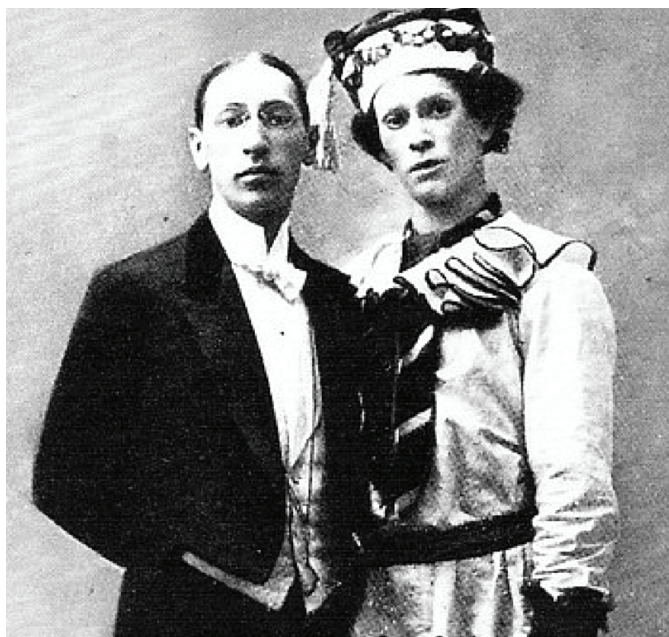
Stravinski i Vaslav Nijinsky en el paper de Petruixka (1911).