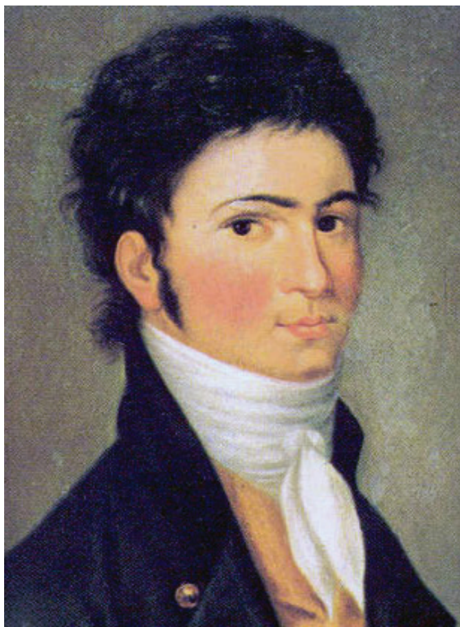
Retrat de Beethoven (1801)

Jörg Demus escrigué: “En l’Adagio sostenuto apareixen totes les característiques de les “ Romances sense paraules ”: acompanyament pianístic en moviment constant (varis centenars de tresets monòtonament giratoris) i, com a contrapart al cant, una línia de baixos curosament mantinguda; damunt, la declamació d’una imaginària veu de contralt... Ho podem veure clarament: Beethoven ens està parlant. Sobre què? Certament no sobre un dolç clar de lluna. També una cançó d’amor —amb la llegenda teixida al voltant de Giulietta Guicciardi— la veig d’una altra manera que en el trist do sostingut menor d’aquesta rígida melodia. Coneixem la gran melangia de Beethoven aquells anys, els seus anhels insatisfets, els seus angiosos temors davant el futur... Beethoven sabia separar la seva música dels sentiments personals... Però, alguna vegada, un caràcter tan fort com el seu, necessita comunicar-se, ha d’obrir-se, com diu el Tasso goethià: “I quan l’home calli les seves penes, doneu-me un Déu, per dir-li, com pateixo”.