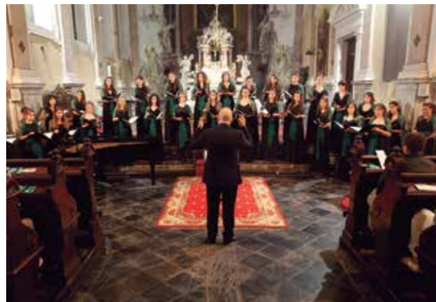
02.07.2015. Cor de Noies de l'Orfeó Català. Cerkev Sv. Jakoba. Ljubljana

El Cor de Cambra, per la seva banda, va protagonitzar tres concerts a capella en la jornada inaugural del prestigiós festival Musikfest de Bremen i una gira amb l'Ensemble Matheus, sota la direcció del francès Jean-Christophe Spinosi, per oferir la Missa Solemnis, en Re major, op. 123 de Ludwig van Beethoven, amb concerts al cicle Palau 100 i a Ais de Provença i Dortmund.