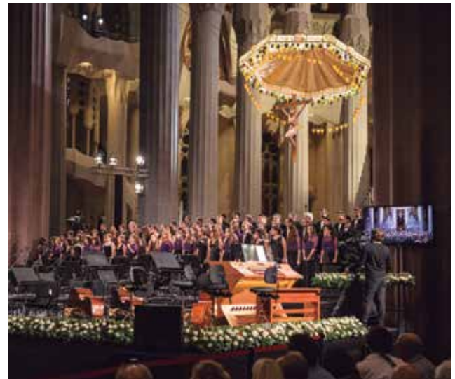
20.09.2015. Cor Jove de l'Orfeó Català. Concert inaugural de la temporada de l'OBC. Sagrada Família

Per la seva banda, el Cor Jove de l'Orfeó Català va actuar a la Sagrada Família, al costat de l'OBC i sota la batuta de Kazushi Ono, en el concert inaugural de la temporada de l'OBC; i també ho va fer a l'avinguda Meridiana de Barcelona amb motiu de la Via Lliure de l'11 de Setembre, amb Albert Guinovart al piano.