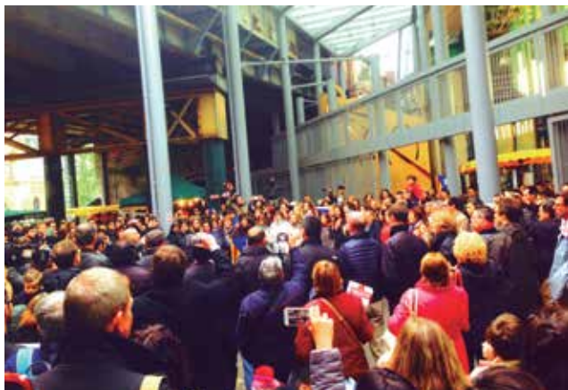
26.04.2015. Orfeó Català. Borough Market. Londres