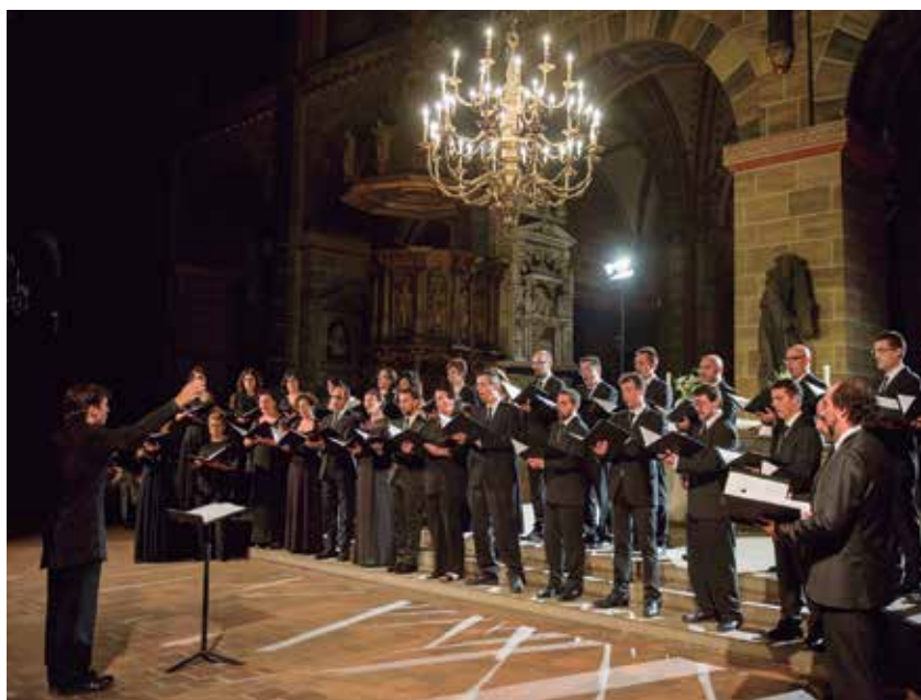
29.08.2015. Cor de Cambra del Palau. St. Petri Dom. Musikfest. Bremen

També el Cor de Noies de l'Orfeó Català va traspasar fronteres amb dos concerts a Ljubljana i Nova Gorica (Eslovènia), en un viatge d'intercanvi amb el cor de noies Bodeča Neža. El nivell i la maduresa dels cors de l'Escola Coral assolits en el transcurs dels darrers anys permet que aquestes formacions estiguin en condicions d'afrontar compromisos internacionals que els enriqueixen tant a nivell musical com personal, en entrar en contacte amb altres cultures.