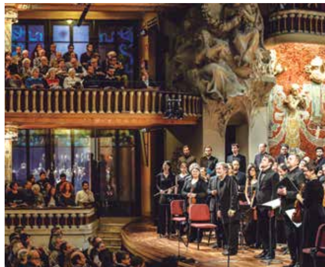
15.03.2015. Jordi Savall. Passió segons sant Mateu . Palau 100 Bach