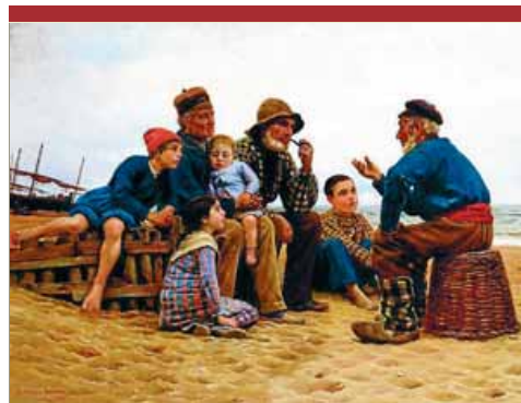
'Escena de platja' (1883), de Dionís Baixeras

La mostra commemorativa Joan Fuster. Nosaltres, els valencians. 1962-2012 coincideix amb el 50è aniversari de l'aparició del cèlebre llibre.