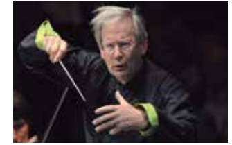
Semele de Händel Sir John Eliot Gardiner, Monteverdi Choir & English Baroque Soloists

Javier Perianes va debutar a la sala modernista al cicle El Primer Palau 1998, més tard arribà el Premio Nacional de Música i, ara, convertit en un dels nostres intèrprets amb més projecció internacional, torna al Palau per abordar una galeria musical de peces del Romanticisme amb Chopin com a bandera i els seus Dos Nocturns, op. 48 , de l'Impressionisme amb Debussy i Falla, i l'estrena de La llum naixent de Joan Guinjoan.