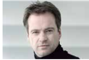
La Tercera de Mahler Jonathan Nott & Gustav Mahler Jugendorchester

Des del Premi Internacional Txaikovski el 2011 a Gramophone a millor artista de l'any 2016, Daniil Trifonov ha conreat una carrera espectacular i impecable, tot convertint-se en un dels pianistes més excitants i inspiradors de la seva generació. Enguany, sota la batuta de Valery Gergiev i acompanyat per l'Orquestra del Teatre Mariïnski, presenta el Concert per a piano d'Scriabin. Un monument musical, poc habitual als programes simfònics, ple d'arpegis llargs i desafiants només a l'abast dels pianistes més exigents. Un programa que es completa amb la participació de l'Orfeo Català a l'èpica cantata Aleksandr Nevski de Prokófiev. Una imponent vetllada d'aromes russes.