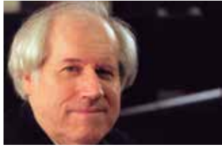
Grigory Sokolov, piano L'edat d'or del piano