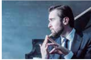
Daniil Trifonov, Orfeo Català & Valery Gergiev

Grigory Sokolov torna a la sala modernista per oferir una nova i inoblidable experiència musical. Sinònim de virtuosisme, clarividència, intensitat, introspecció i naturalitat, els seus concerts van més enllà d'un simple recital; són un dels regals més commovedors i revitalitzadors per a l'oïda i l'ànima. En aquesta ocasió gaudirem de Beethoven i del Brahms postsimfònic, amb les Sis peces per a piano, op. 118 i Quatre peces per a piano, op. 119 .