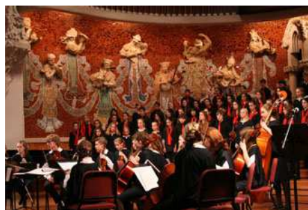
El Cor Tapiola i el Cor Infantil de l'Orfeó Català.

Publicat per Redacció el 19 març 2013 a Crítica · 0 Comentaris