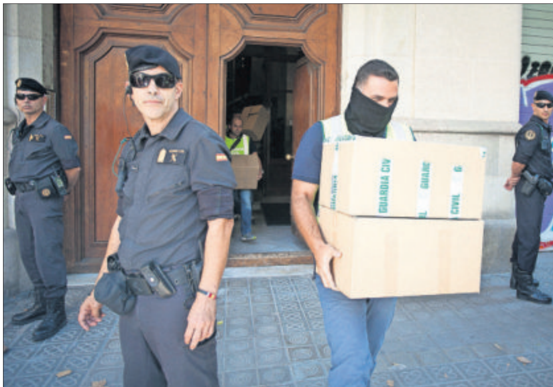
La Guardia Civil, durante uno de los registros en la sede de CatDem, en agosto de 2015.