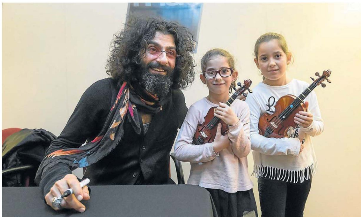
Ara Malikian, violinista libanés nacionalizado español, junto a dos jóvenes admiradoras que acudieron a la FNAC a conocerle. GUILLERMO MESTRE

● El violinista Ara Malikian firma en Zaragoza ejemplares de su último disco. Las entradas para su concierto del 30 de diciembre, agotadas desde hace semanas