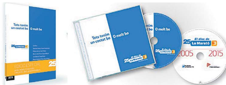
La Marató ha preparado un libro y un doble disco para recaudar fondos de cara a esta edición.