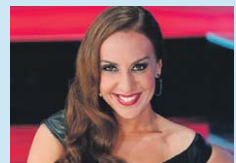
■ Mónica Naranjo. Canta "Avui vull agrair", el himno de esta edición.