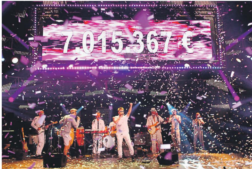
La pasada edición de La Marató estuvo dedicada a la diabetes y la obesidad.

A parte de este trabajo conmemorativo, Diari de Terrassa, como cabecera que colabora con La Marató, también ofrecerá a sus lectores la opción de tener un segundo disco, no ya recopilatorio, sino el propio de La Marató de este año. Incluirá "Avui vull agrair", un tema al que pone voz la cantante catalana, Mónica Naranjo, y que será el himno de esta edición. Otros artistas también se han sumado a la iniciativa. Es el caso de Sole Giménez,