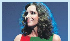
■ Ana Belén. Canta, también en catalán, uno de sus clásicos, "Desde mi libertad."