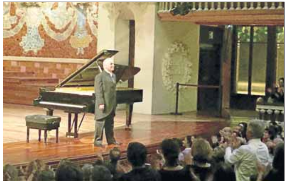
Daniel Barenboim al final del concert, dijous al Palau de la Música

Barenboim va oferir un repertori que estima a base de Schubert, Chopin i Liszt. Què es pot dir davant