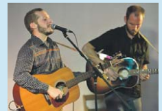
■ Pantaleó. También de Terrassa, el grupo ha preparado el tema "Vespre".