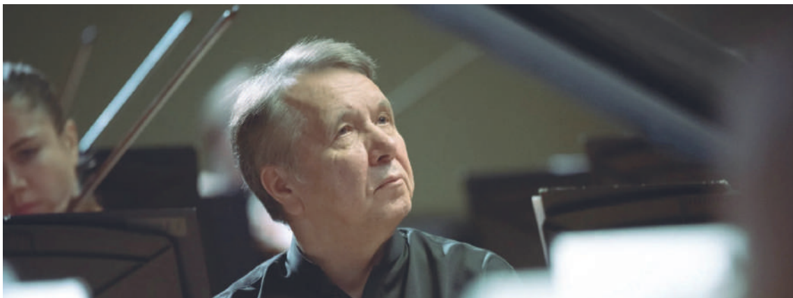
MIKHAIL PLETNEV PIANO