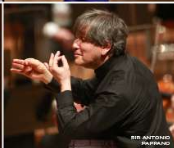
SIR ANTONIO PAPPANO