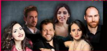
29.07 VESPRES D'ARNADI DANI ESPASA