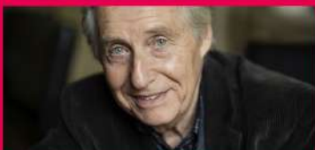
13.08 JOAQUÍN ACHÚCARRO PIANO