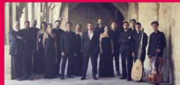
11.08 ENSEMBLE O VOS OMNES