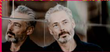
30.07 ORCHESTRA OF THE AGE OF ENLIGHTENMENT MARK PADMORE