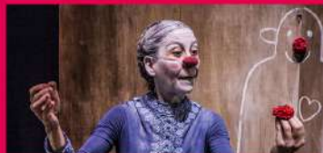
11.08 ESTACIÓ PARADÍS LA HISTÒRIA D'AMOR D'UNA VELLA TITELLAIRE