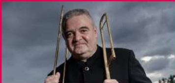
04.08 LES SACQUEBOUTIERS