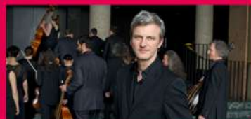
17.08 LE POÈME HARMONIQUE