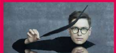
18.08 VÍKINGUR ÓLAFSSON PIANO