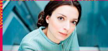
02.08 YULIANNA AVDEEVA PIANO