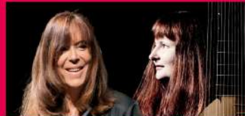
06.08 MARIA DEL MAR BONET & L'ARPEGGIATA