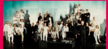
09.08 CHAMBER ORCHESTRA OF EUROPE