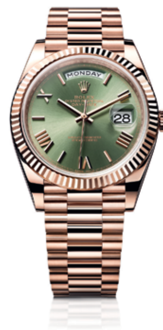
OYSTER PERPETUAL DAY-DATE 40

Este reloj ha presenciado el origen de la próxima generación de músicos. Ha acompañado a un director cuya pasión y brillantez han inspirado a las mejores orquestas del mundo para alcanzar cumbres aún más altas. No solo marca el tiempo. Marca su época.