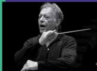
Zubin Mehta & Orchestra del Maggio Musicale Fiorentino Sinfonia n.º 7 de Beethoven i Sinfonia n.º 4 de Txaikovski DILLUNS, 09.04.18