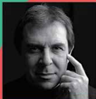
Daniele Gatti, Mahler Chamber, Orfeó Català & Cor de Cambra del Palau La Novena de Beethoven DIJOUS, 26.04.18