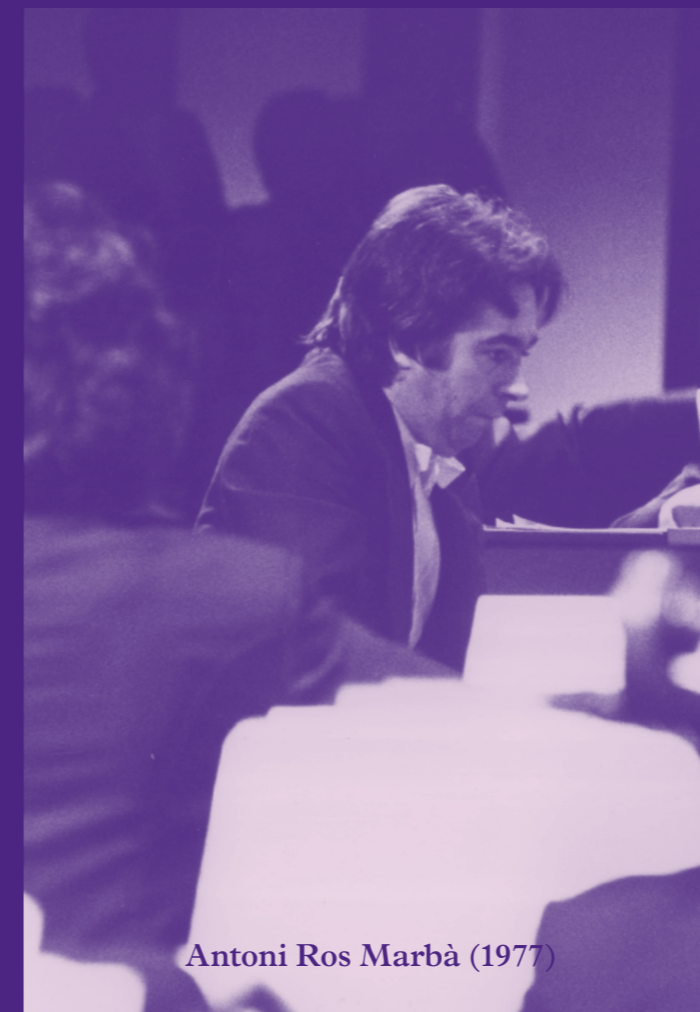
Antoni Ros Marbà (1977)