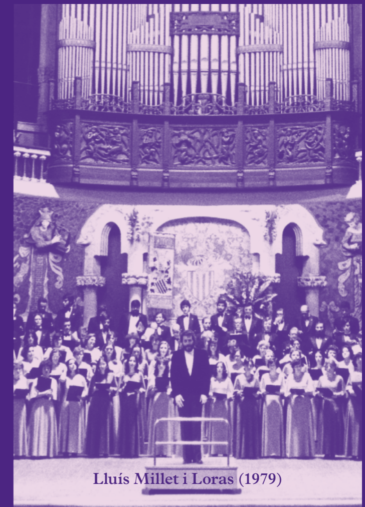
Lluís Millet i Loras (1979)