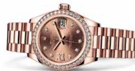
OYSTER PERPETUAL LADY-DATEJUST 28

ESTE RELOJ HA VISTO LOGROS MAGISTRALES Y UNA ELEGANCIA EXCEPCIONAL.