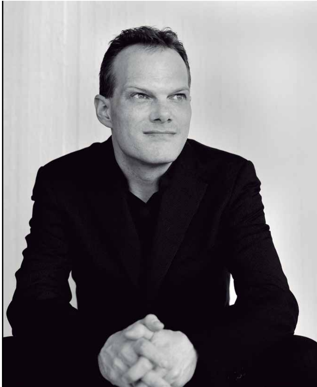
Lars Vogt, piano

S'ha consagrat com un dels pianistes més reconeguts de la seva generació. Nascut a Düren (Alemanya) el 1970, va cridar l'atenció del públic en obtenir el segon lloc del Concurs Internacional de Piano de Leeds el 1990, i des de llavors ha ofert concerts i recitals per tot Europa, Àsia, Austràlia i Amèrica.