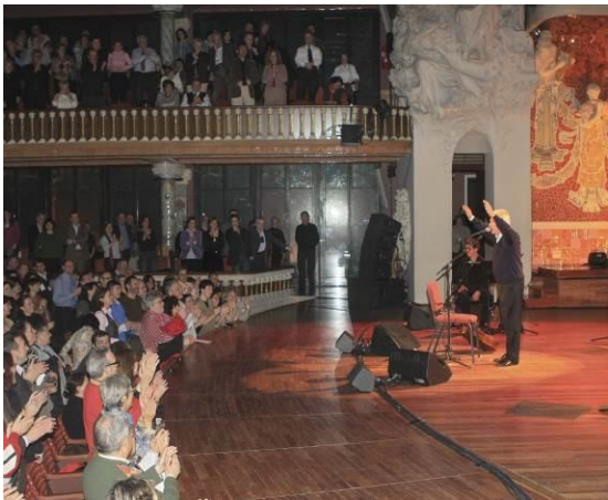
2008. Concert del Centenari del Palau