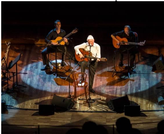
2014. Concerts antològics al Palau