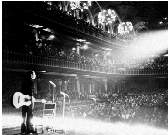
1967. Primer recital en solitari al Palau