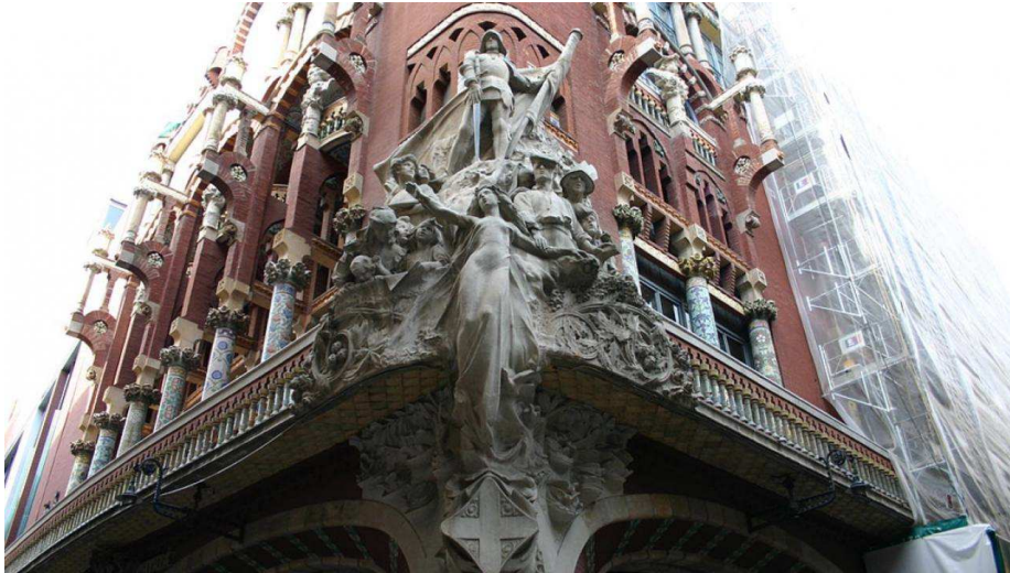
El Palau de la Música Catalana, seu de l'Orfeó Català

també a l' Hospital de la Santa Creu i Sant Pau . Tant aquest centre hospitalari com la seu de l' Orfeó Català són edificis Patrimoni de la Humanitat de la UNESCO .