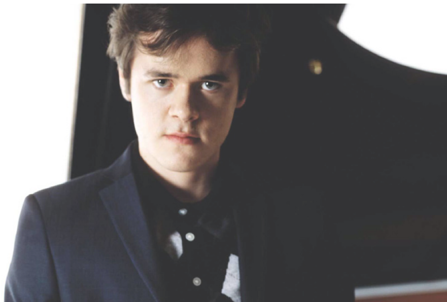
Benjamin Grosvenor. © Decca/Sussie Ahlburg (foto d'arxiu)

Redacció on 27 maig, 2016 / Comments closed