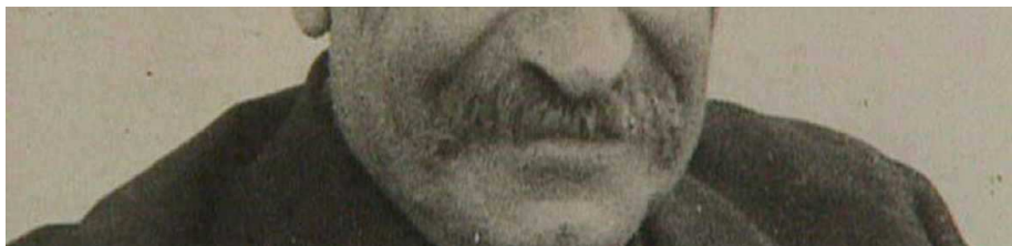
L'Orfeó Català: La veu centenària de Lluís Millet

TVE Catalunya ha dedicat també monogràfics a la institució, com en ocasió dels seus 90 anys . El programa, de 24 minuts de durada, inclou imatges del fundador Millet i Pagés i de la primera seu social de l'Orfeó , al carrer Lladó, abans de l'edificació del magnífic Palau de la Música Catalana .