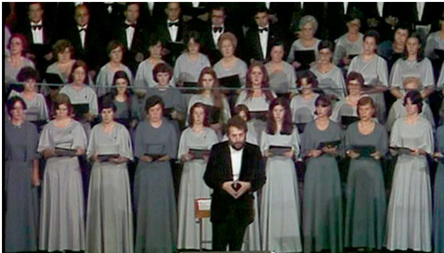
Orfeó Català - Concert a capella 1981