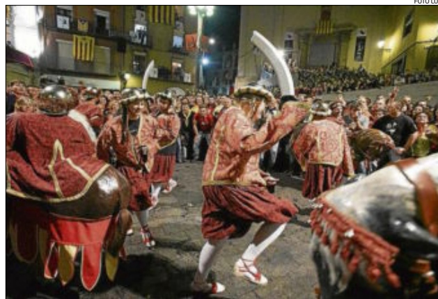
Els turcs i cavallets en una imatge de l'edició d'enguany de la Patum

A la revista El Bergadán del 27 de maig del 1877, número monogràfic dedicat íntegrament a la concessió del títol de Ciutat a la fins aleshores Vila Reial de Berga. El nomenament de ciutat de Berga en certa manera volia ser un reconeixement i agraïment de la monar-