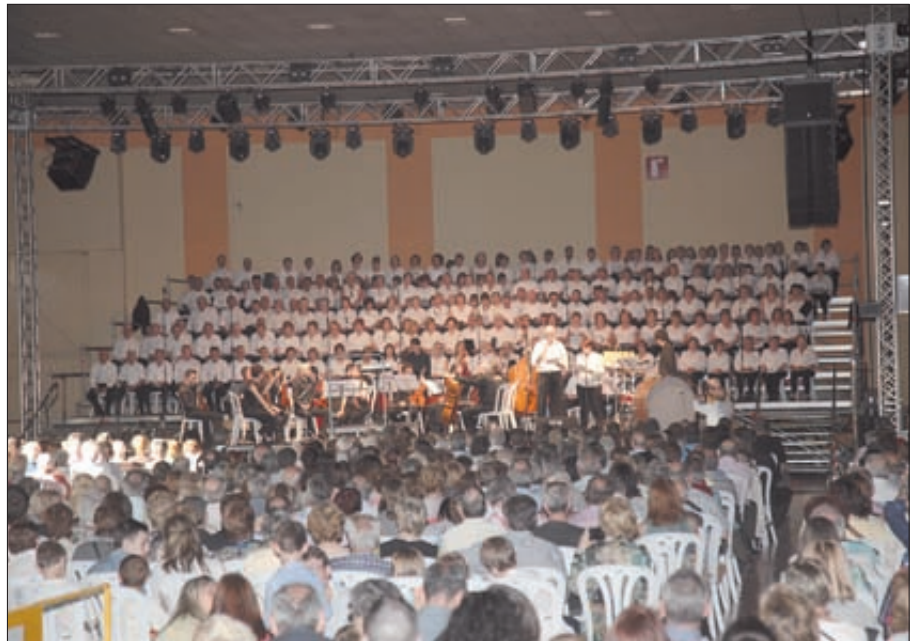
La Cantata '1714 - 2014, 300 anys venent' va fer emocionar el nombrós públic dek Pavelló Firal