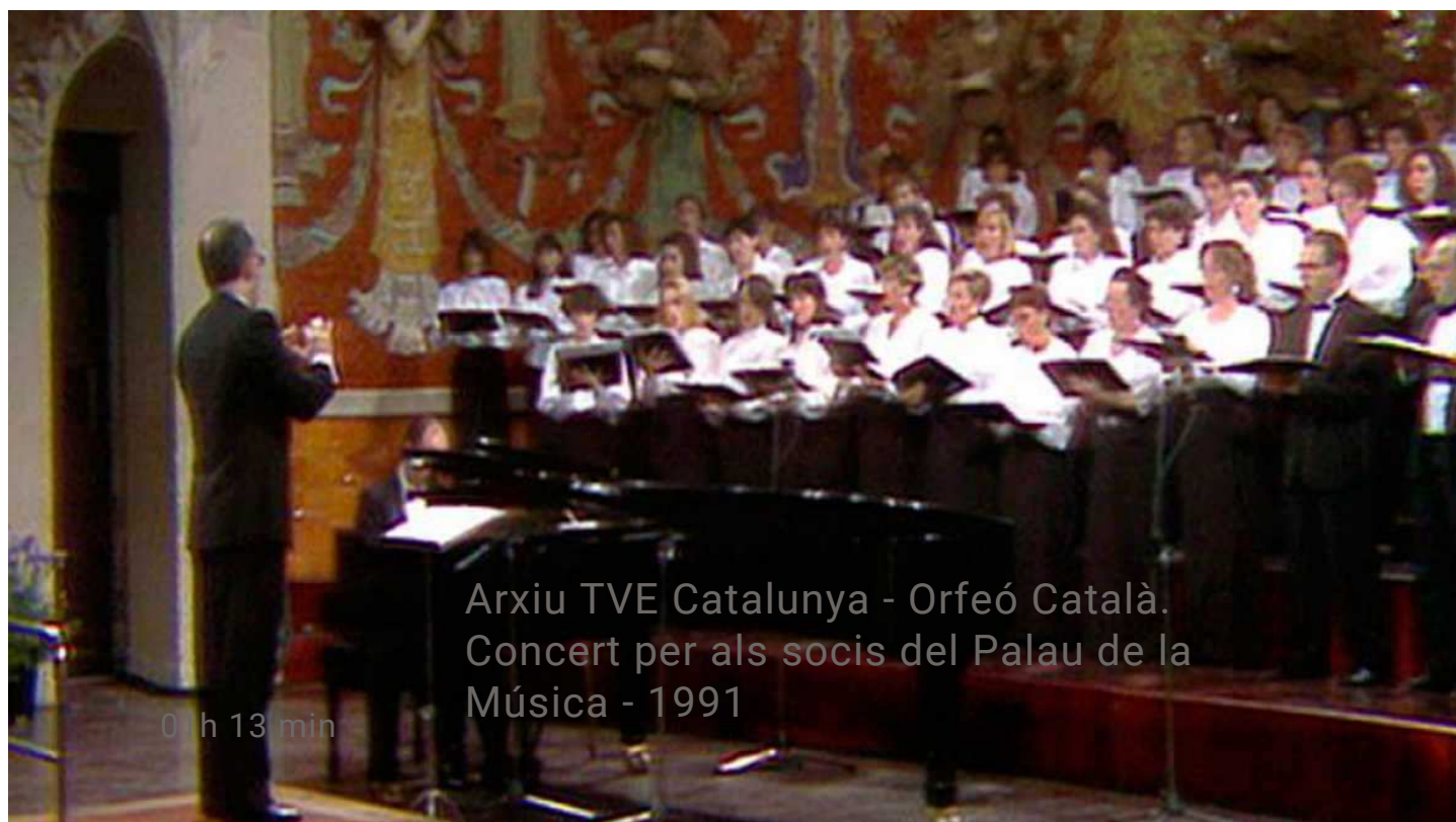
Orfeó Català. Concert per als socis del Palau de la Música - 1991