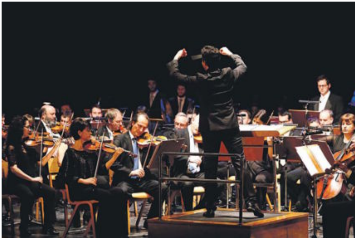
Un anterior concierto de la Orquesta Simfònica del Vallès en el Centre Cultural.

El texto (que toma solo una parte del poema de Schiller, de la versión de 1808, y que Beethoven modificó por necesidades musicales o de ritmo) está cantado en el cuarto